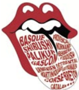
Affiche appartenant à l'exposition réalisée par l'association française des Petits Débrouillards (AFDP) - Conception, réalisation : ScherLafarge

tourner des centaines de fois sa langue dans sa bouche