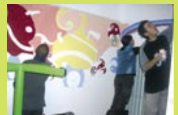
Réalisation d'une fresque