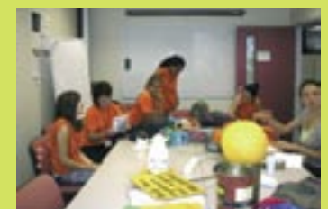
Réunion de travail