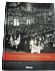
«La Belle histoire» édité chez Glénat

58.7% des personnes interrogées ont gagné. La ganterie grenobloise était l'activité la plus importante et la plus traditionnelle de l'agglomération grenobloise du 18 ème au 20 ème . Albert Pierre Raymond créa en 1865 une manufacture qui invente des fixations pour la ganterie, la maroquinerie et les chaussures. C'est ainsi qu'il a créé le premier bouton pression et déposé quelques 600 brevets. Sa devise « j'ai compris en mon temps que l'entreprise ne vaut que par les gens qui en font partie ».