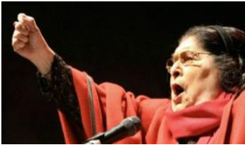
Mercedes Sosa : le souvenir de la voix de tous les sans voix d'un continent

À 74 ans, la « negra » nous a quittés le 4 octobre dernier, après une longue maladie. Née à Tucumán, dans le nord d'Argentine, elle a débuté dans la chanson à 15 ans et a même joué dans deux films. Faisant partie de « la nueva canción » engagée socialement et politiquement. Elle a notamment fait connaître le répertoire de Violeta Parra. Arrêtée lors d'un concert sous la