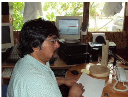
L'animateur sur les ondes : le matériel a subi pour 5000€ de dégâts lors du tremblement de terre

*Contribuer à la formation d'une proposition de développement sur le territoire où se trouve la radio