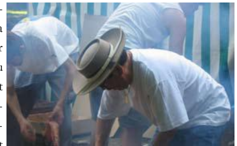
Asado : lieu de mémoire commune

l'Asado à Vizille. DVD en vente au prix de 12 €, à l'asado ou en nous contactant