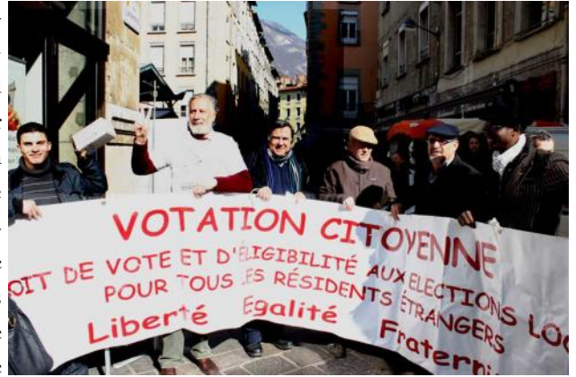
Votation Citoyenne Place aux Herbes, le 6 mars 2010

ya danger pour la démocratie. Parions que si nous ne démantelons pas à temps, ces Centres serviront à nous y interner pour « délit de solidarité ». Nos combats n'ont jamais été faciles, mais ils n'ont été jamais aussi nécessaires pour que