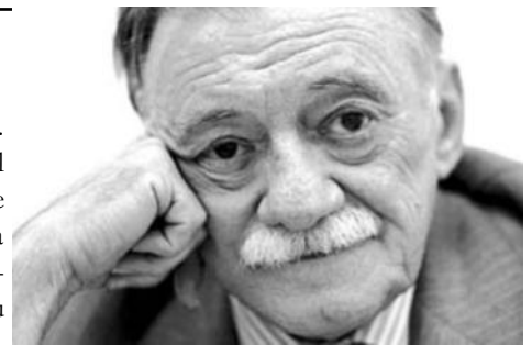
te extrañaremos, pero nunca habrá olvido.

ment au pouvoir. Contraint à l'exil pendant la dictature militaire, de 1973 à 1985, il n'a malheureusement pas pu voir l'arrivée au pouvoir du Pepe Mujica.