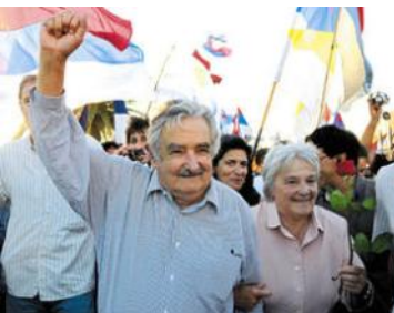
José « Pepe » Mujica nouveau président élu et la sénatrice Lucia Topolansky sa compagne